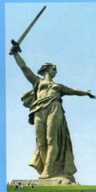
Монумент «Родина-мать зовёт!» на Мамаевом кургане