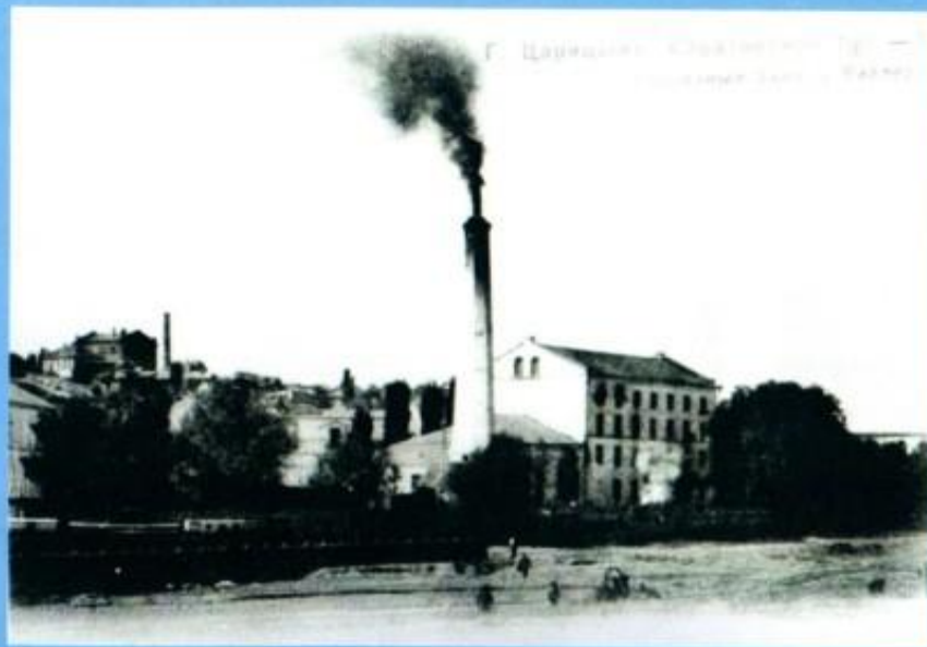
Немецкая колония «Сарепта»