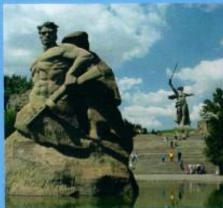
Скульптура «Стоять насмерть»

После войны в ключевых местах боев были установлены многочисленные памятники Сталинградской битвы, разрушенных здания оставлены как памятники.