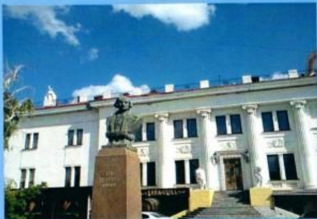
Старейший из сохранившихся — памятник Гоголю 1910 года в Комсомольском саду